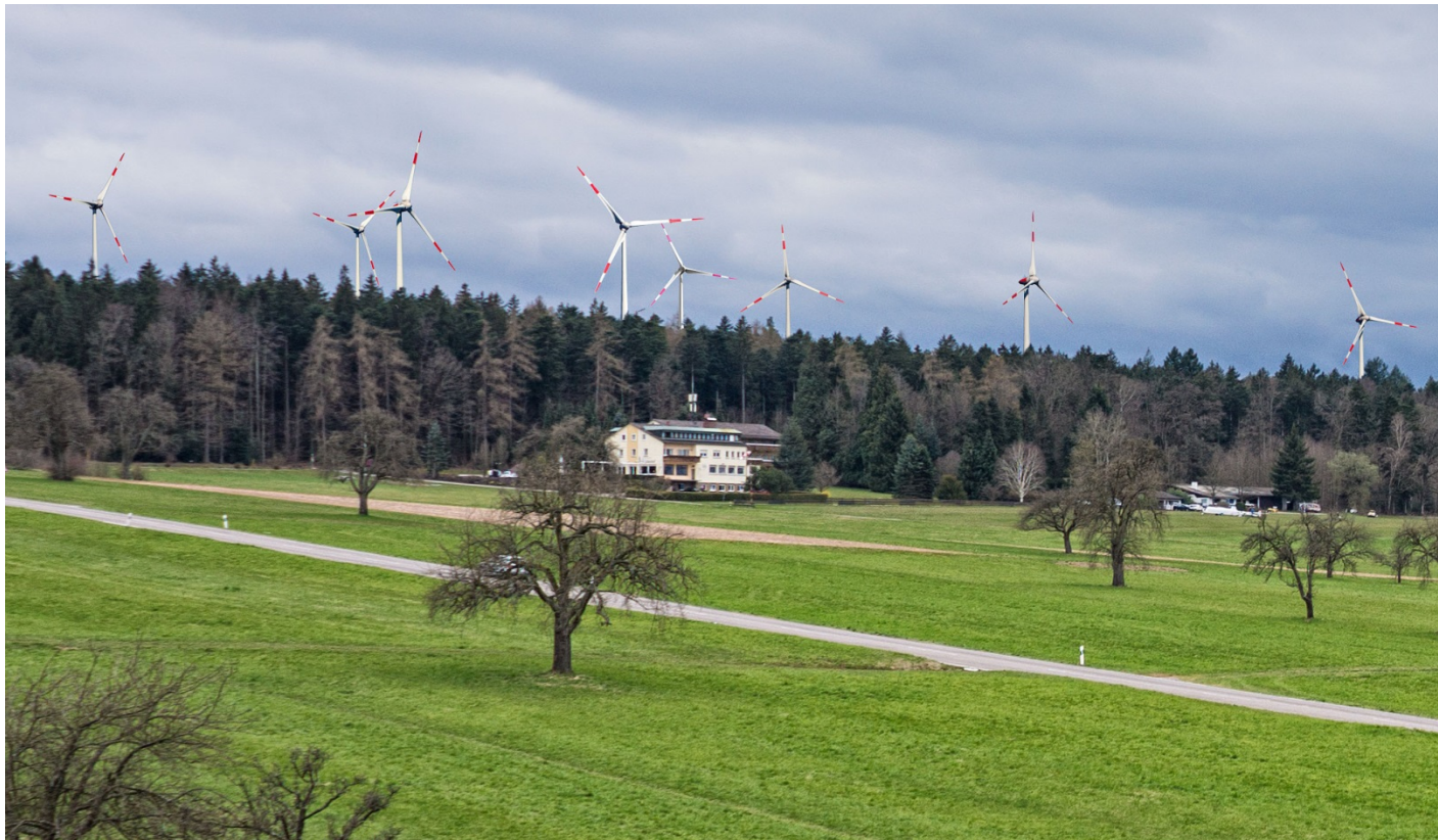
Fotomontage Blick auf die Schwanner Warte, maßstabsgetreu nach Planunterlagen dargestellt